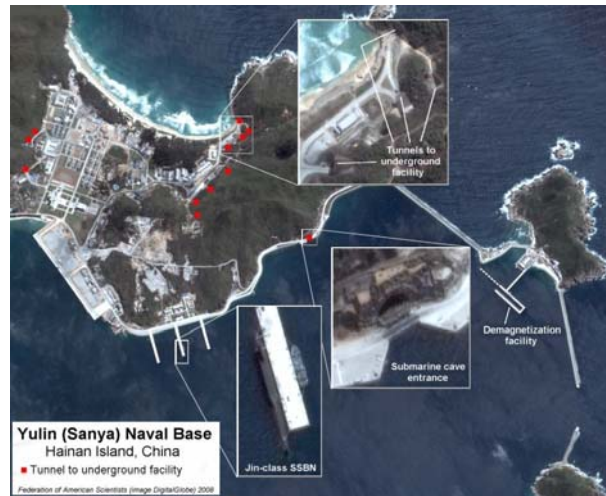
Base chinoise sur l'île de Hainan