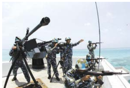
Des îles transformées en bunker